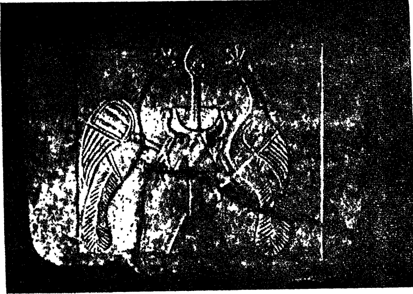
Proto-Bulgarian picture in relief (7-8th century).